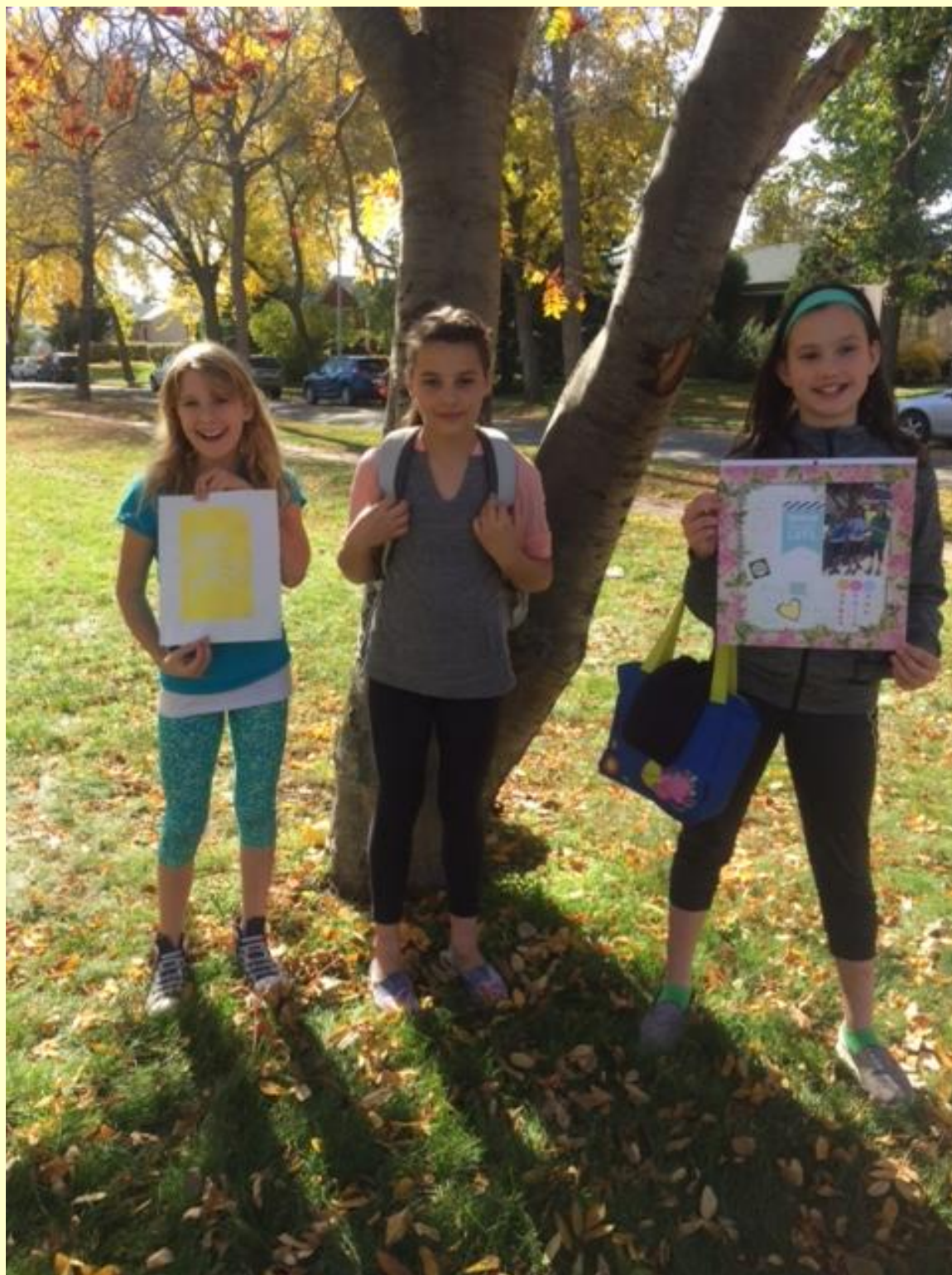
Journée des 6 ième à Edmonton. Bravo les filles !