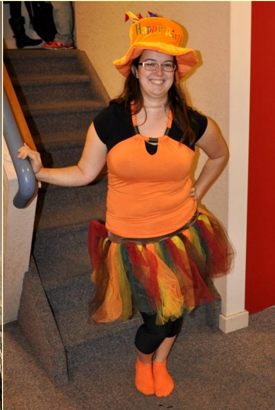
Les petits et les grands ont participé à la fête de l'Halloween