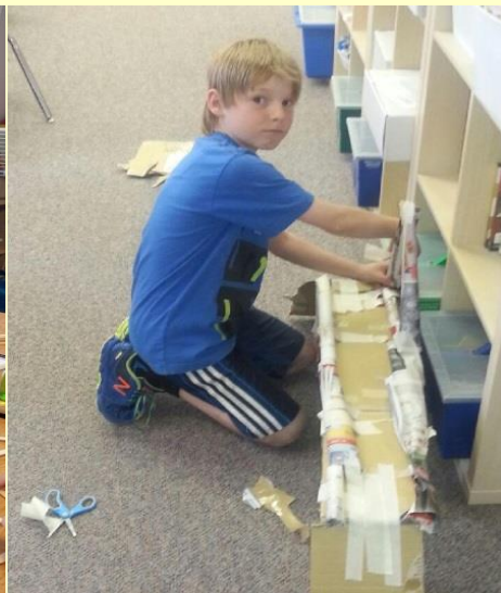
Science 2 ième et 3 ième : Construction de tabourets et ponts