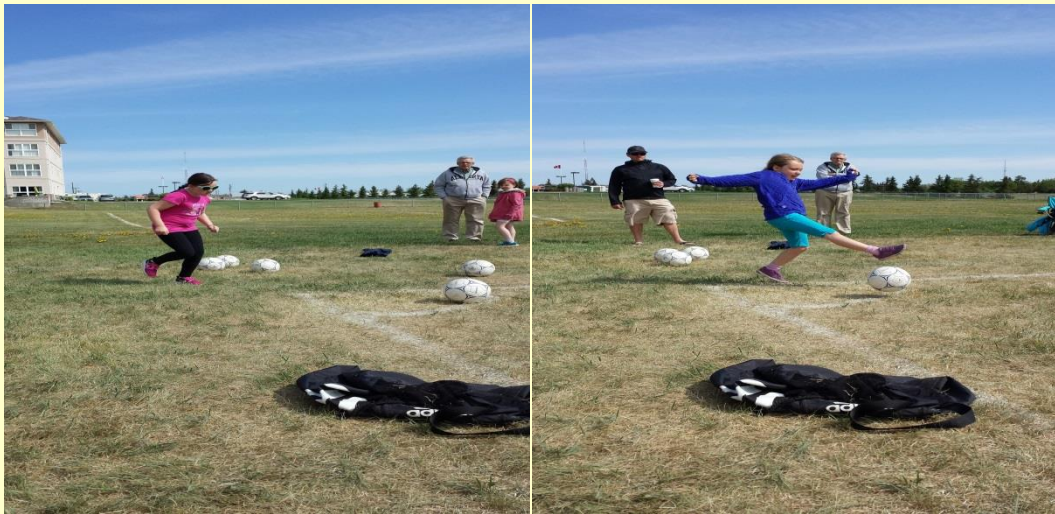
JEUX OLYMPIQUES MAI 2015