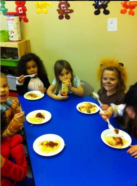
Le repas chaud