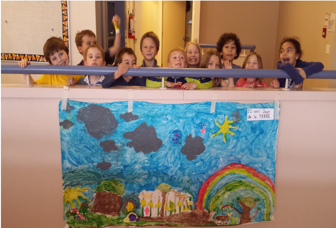
Journée de la terre