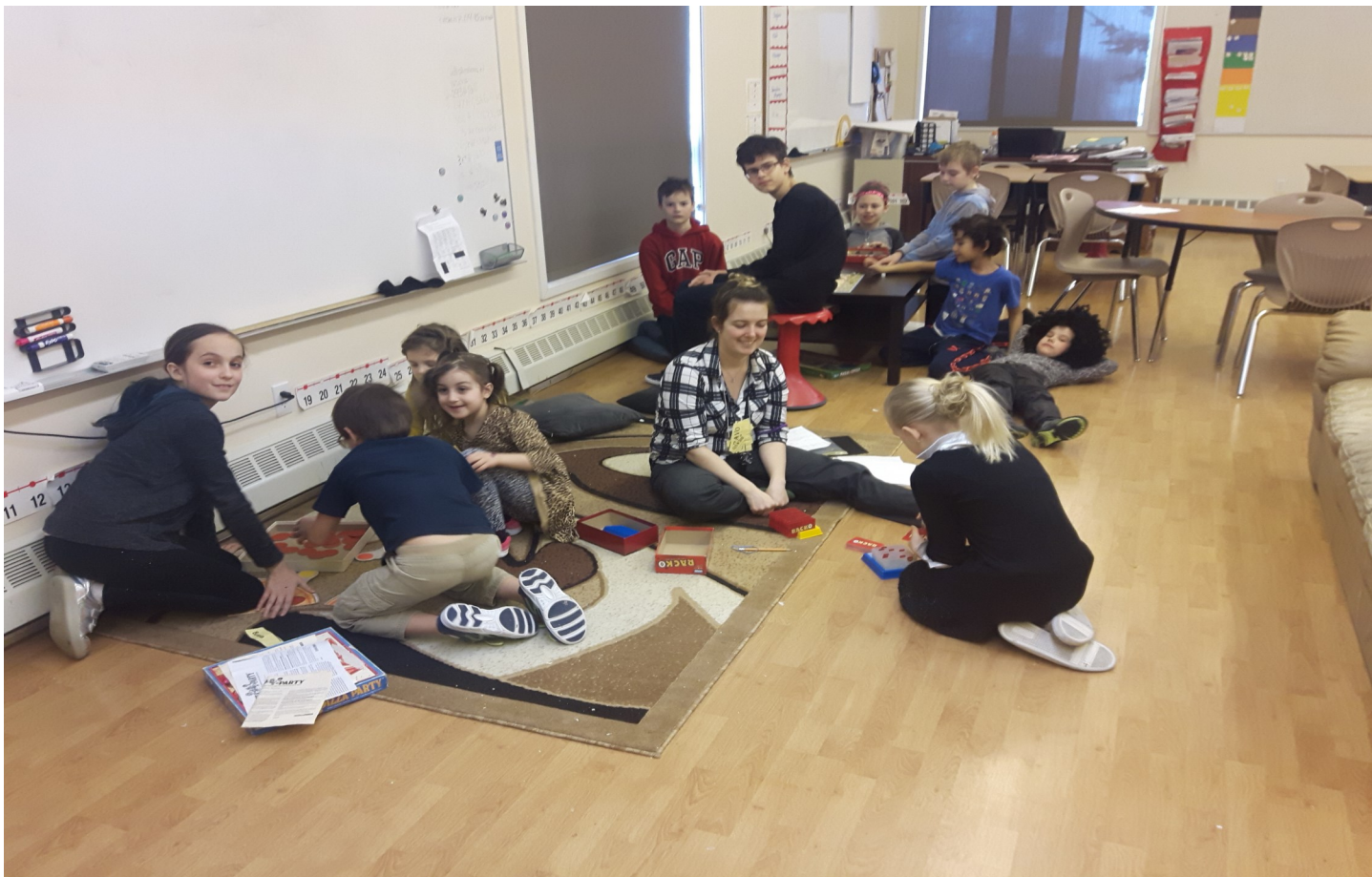
En février, nous avons eu la journée des cheveux fous.